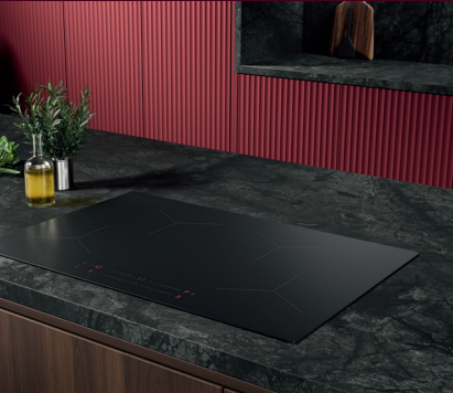
Dezentes, minimalistisches Design

Dezentes, mattschwarzes Finish Minimalistisch und elegant Widerstandsfähiger gegen sichtbare Kratzer* Fügt sich nahtlose in modernes Küchendesigns ein