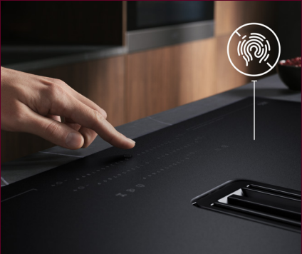
Resistent gegen Fingerabdrücke für eine stets makellose Optik