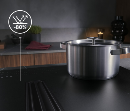
Mattschwarze Eleganz mit 80 % weniger Lichtreflexionen