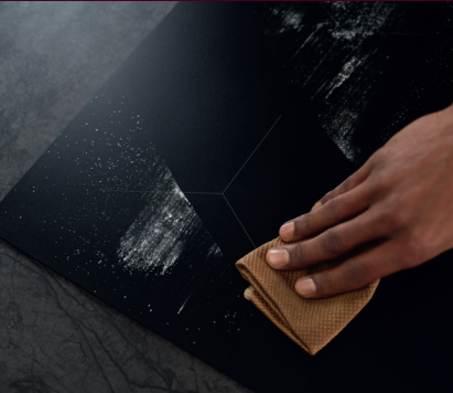
Kratzresistenter als AEG Standard- Glaskeramikkochfelder*