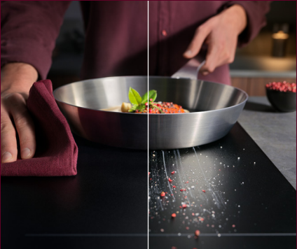
Höchste Kratzresistenz* für langlebige Schönheit

Unsere kratzresistenteste* Induktionskochfeld-Oberfläche Mattes Schwarz – fügt sich nahtlos in moderne Küchenwelten ein 80 % weniger Lichtreflektion für eine perfekte Mattoptik Anti-Fingerprint-Effekt für eine dauerhaft edle Oberfläche