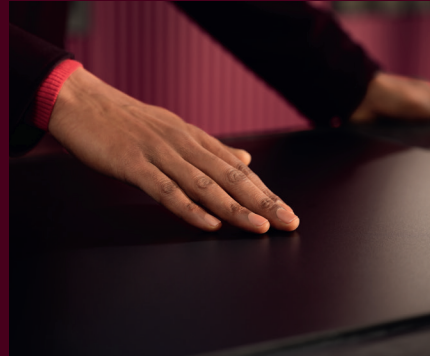
Die spezielle Beschichtung verleiht eine einzigartige Optik